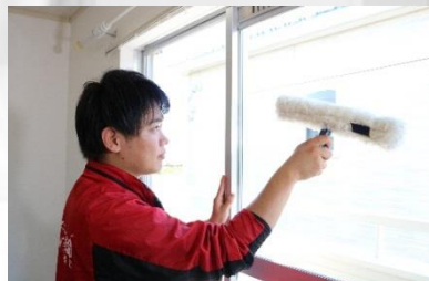
(※1) スクイジー仕上げ